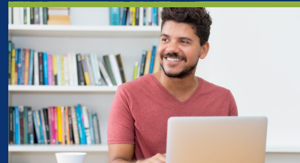
Grado Profesional en Comunicación