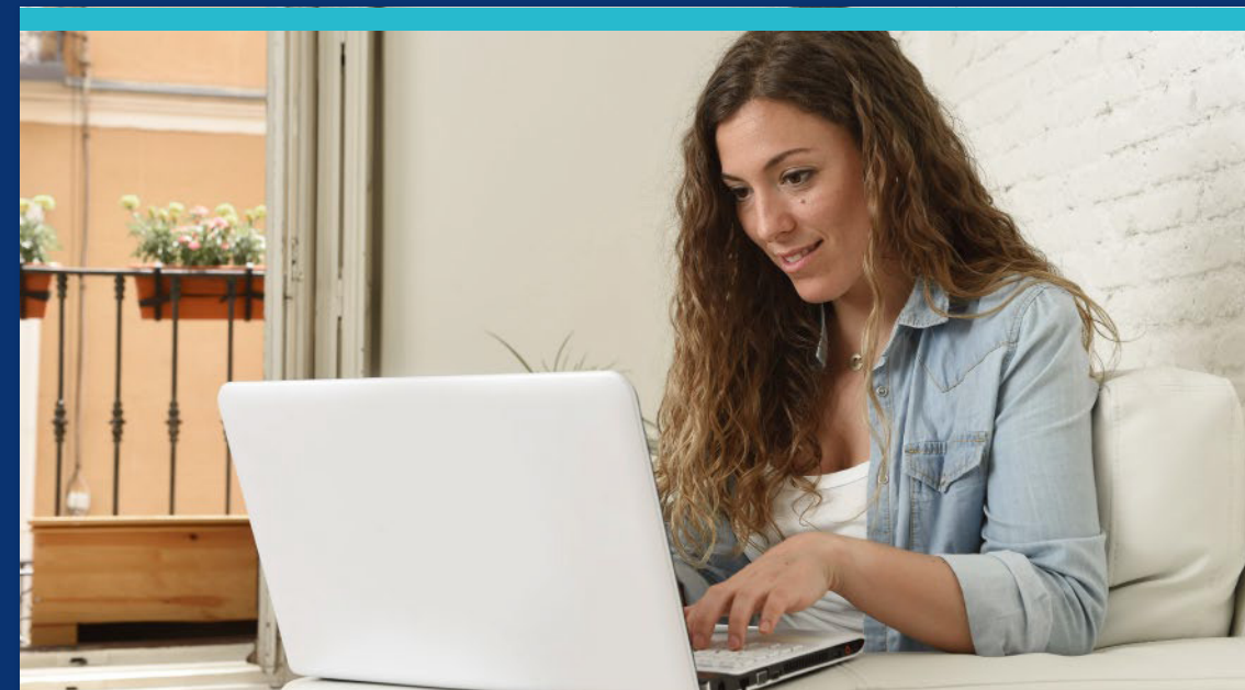
Grado Profesional en Mercadotecnia